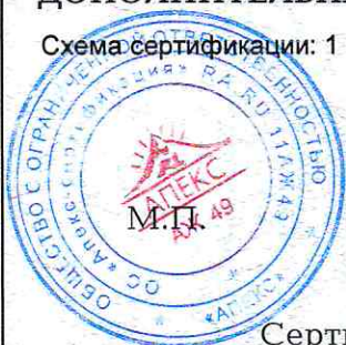
Схема сертификации: 1